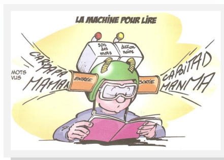
Illustration Le tiroir coincé , d'Anne-Marie Montarnal